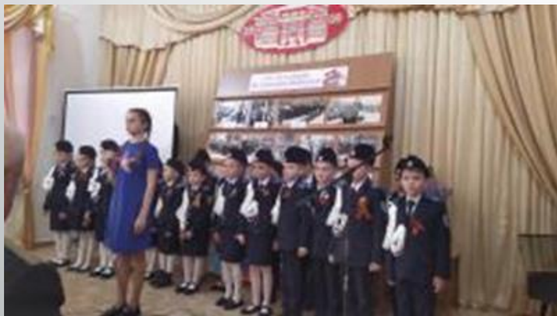
ВЫСТУПЛЕНИЕ ПЕРЕД ВЕТЕРАНАМИ ВОВ В Сакском краеведческом музее