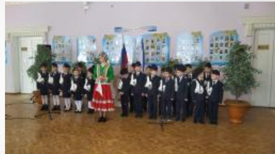
Конкурс казацкой песни