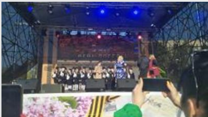
ВЫСТУПЛЕНИЕ НА БОЛЬШОЙ СЦЕНЕ